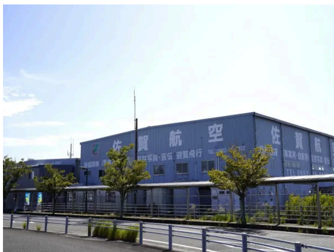
九州佐賀国際空港の東に位置する当社